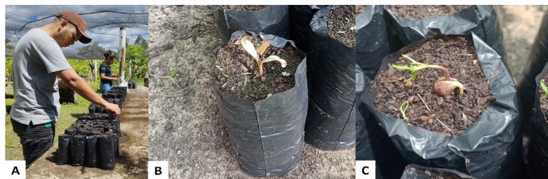
FIGURA 2. Semeadura e germinação. A – Semeadura/ B – Germinação do Urucum/ C – Germinação da Fava de Bolota

Buscou-se saber de cada entrevistado o quanto que eles consideram que o desmatamento que é presente na região tem influenciado na diminuição das abelhas e do alimento delas. Sendo assim, a figura traz uma representatividade do que os moradores das comunidades entendem sobre o tema, onde muitos deles apontaram a importância da introdução dessas plantas no ambiente da região. As sementes foram colocadas em composto orgânico preparado na própria estação. Os sacos foram organizados e em seguida houve a semeadura. Dentro de 5 dias, algumas sementes já estavam em processo germinativo (Figura 2). Ao decorrer do desenvolvimento (Figura 3), juntamente com a equipe técnica da estação, houve a condução e manejo das plantas a fim de estarem em bom estado para doação e prática na oficina de mudas.