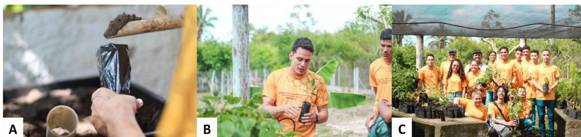
FIGURA 5. Oficina de produção de mudas e distribuição das mudas. A – Prática de sacaria / B – Explicação sobre as mudas para os participantes / C - Distribuição

A oficina (Figura 4) de produção de mudas ocorreu juntamente com o evento “II workshop sobre a cadeia produtiva do mel no Maranhão”. Nela, pode-se repassar aos participantes uma parte teórica e prática de como proceder no preparo de substrato, aquisição de sementes, condução e manejo além de enfatizar a importância da conservação e contribuição para as abelhas presentes na região da baixada maranhense.