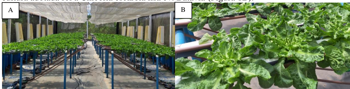
FIGURA 1. Área experimental em uso (A) e cultura da chicória lisa (B).

MATERIAL E MÉTODOS: O experimento foi conduzido na Estação de agricultura irrigada do Departamento de Engenharia Agrícola (DEAGRI) da Universidade Federal Rural de Pernambuco, Campus SEDE , Recife – PE, em ambiente protegido do tipo casa de vegetação no período, de setembro a novembro de 2023. O sistema hidropônico utilizado foi o NFT (técnica de fluxo laminar de nutrientes). A Estrutura experimental foi composta de 64 perfis hidropônicos trapezoidais de 75 mm, com orifícios espaçados a 0,25 m (Figura 1A). A cultura adotada foi a Chicória escarola lisa cv. Batávia (Figura 1B).