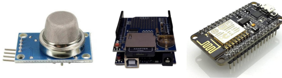
FIGURA 1. Sensor de CO 2 MQ-135 (A), Placa Arduino conectada ao Data (B), ESP8266 NodeMCU (C).

visualização e análise em tempo real dos dados coletados. Durante os experimentos, o sensor MQ135 continuou a realizar leituras contínuas das concentrações de CO 2 , o aplicativo ThingSpeak registrou e exibiu os dados em um formato acessível, permitindo uma análise detalhada das tendências e padrões ao longo do tempo.