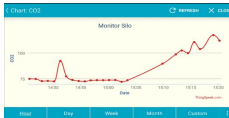
FIGURA 5. Gráfico reproduzido pelo aplicativo ThingsSpeak.

CONCLUSÕES: O protótipo desenvolvido mostra promessa na monitorização da qualidade do ar em ambientes de armazenamento agrícola, especialmente na medição de CO 2 com o sensor MQ135. Embora os resultados iniciais sejam encorajadores, reconhecemos a necessidade de aprimoramento e validação comparativa com instrumentos estabelecidos. O próximo passo envolve confrontar os resultados do protótipo com um medidor multifuncional de qualidade do ar, incluindo TVOC (Compostos Orgânicos Voláteis Totais), para validar sua precisão. Com ajustes, o protótipo pode se tornar uma ferramenta confiável para a monitorização da qualidade do ar em ambientes de armazenamento agrícola, contribuindo para a preservação de produtos pós-colheita.