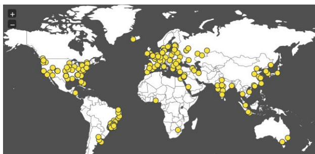
FIGURA 2. Distribuição gráfica dos acessos por diferentes IPs à página www.bslonclouds.com

RESULTADOS E DISCUSSÃO: Os resultados evidenciam a eficiência do uso de um sistema no modelo “nuvem” para compartilhar trabalhos científicos, com o acesso de 3.575 acessos no período de um ano de disponibilização. Na Figura 2, é possível observar a distribuição dos diferentes IPs que acessaram a plataforma, no Brasil e no mundo.