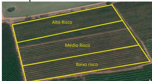
FIGURA 1. Divisão da área experimental em função das zonas de risco climático.

(Figura 1). Essa classificação considerou critérios que avaliam a variação de altitude e topografia, levando em conta variações na inclinação do terreno e, principalmente a configuração do terreno. A designação de "Alto Risco" abrange a área de baixada, caracterizado por altitudes mais baixas, enquanto a classificação de "Baixo Risco" compreende a encosta do terreno. Essa categorização busca refletir a influência da topografia na exposição das áreas de riscos específicos à severidade de dano da geada.