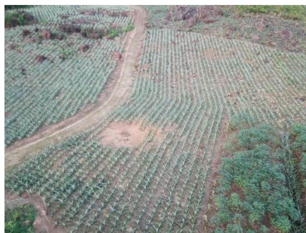
Figura 2. Análise detalhada do plantio de abacaxi em Turiaçu

Os dados coletados foram altamente precisos. Devido à área expandida, o software precisou processar os dados de maneira mais eficiente, visto que a quantidade de pixels por unidade de área foi menor do que na amostragem anterior. É importante ressaltar que a quantidade de pixels em uma imagem está relacionada diretamente com a resolução e não necessariamente com a qualidade. A utilização dessas tecnologias permite uma análise detalhada das áreas cultivadas, possibilitando a rápida identificação e correção de possíveis problemas no plantio. A imagem gerada pelo drone e pelo software conforme mostrado na figura 2, representa uma análise detalhada do plantio, fornecendo orientação para agrônomos durante a inspeção e acompanhamento diário das lavouras.