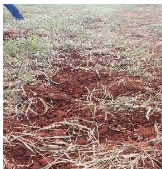
Figura 3. Cobertura do solo na entre linha de plantio.

RESULTADOS E DISCUSSÃO: A partir da avaliação realizada no campo, foram obtidos resultados do perfil formado no preparo com o paraplow rotativo em quatro pontos onde obtivemos as dimensões da largura inferior LI, LS e Pe (figura 4). Notou-se que na linha de preparo a área mobilizada ficou como esperado, no formato de um trapézio invertido, e o sulco ficou com o solo bem preparado e a cobertura vegetal foi mantida por toda camada superficial com exceção da linha de preparo (Figura 3), contemplando a proposta inicial do paraplow rotativo que é o preparo conservacionista do solo. Os resultados da caracterização da área de plantio formada no preparo do paraplow rotativo (Tabela 1) estão em concordância com o que foi proposto por Albiero (2006), indicando que o serviço realizado pela nova versão do porta ferramenta foi bem sucedido.