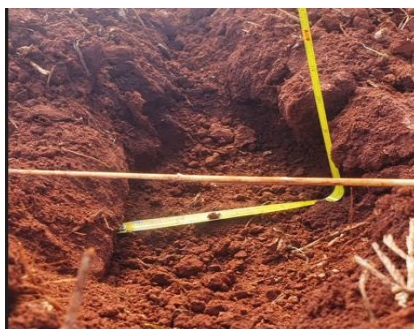
Figura 2. Geometria trapezoidal de preparo.

RESULTADOS E DISCUSSÃO: A partir da avaliação realizada no campo, foram obtidos resultados do perfil formado no preparo com o paraplow rotativo em quatro pontos onde obtivemos as dimensões da largura inferior LI, LS e Pe (figura 4). Notou-se que na linha de preparo a área mobilizada ficou como esperado, no formato de um trapézio invertido, e o sulco ficou com o solo bem preparado e a cobertura vegetal foi mantida por toda camada superficial com exceção da linha de preparo (Figura 3), contemplando a proposta inicial do paraplow rotativo que é o preparo conservacionista do solo. Os resultados da caracterização da área de plantio formada no preparo do paraplow rotativo (Tabela 1) estão em concordância com o que foi proposto por Albiero (2006), indicando que o serviço realizado pela nova versão do porta ferramenta foi bem sucedido.