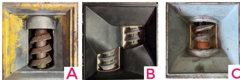
FIGURA 1. Dosador JD Prometer ® (A), TP Duplo sem-fim ® (B) e FS Auto-lub AP NG ® (C).

através do método padrão da estufa a temperatura de \pm 105^{\circ}\text{C} , proposto por Alcarde et al. (1967). As caracterizações foram realizadas em quatro repetições de 100 g de fertilizante cada.