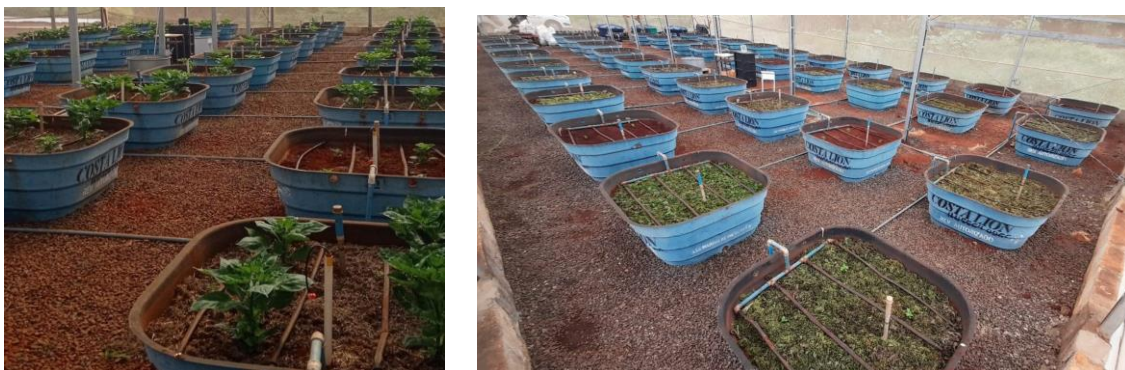
FIGURA 1. Espaçamento das pimentas (à esquerda) e distribuição dos adubos nas parcelas (à direita).

MATERIAL E MÉTODOS: O experimento foi conduzido em uma estufa agrícola com 210m 2 de área, pertencente ao laboratório de Tecnologia de Produção e Sanidade Vegetal, do Departamento de Engenharia de Biosistemas, na Faculdade de Zootecnia e Engenharia de Alimentos (ZEB/FZEA/USP), no município de Pirassununga-SP, com altitude de 627m, latitude de 21°59'S e longitude 47°25'W. O clima na região é do tipo Cwa (subtropical úmido) na classificação de Koppen, a temperatura média anual é de 20,8°C, com precipitação pluviométrica média anual de 1089 mm. O delineamento experimental foi em blocos casualizados, em esquema fatorial (5x2) com quatro adubos verdes a saber: Canavalia ensiformis (feijão-de-porco), Crotalaria spectabilis (crotalária-spectabilis), Pennisetum glaucum (milheto), Dolichos lablab (lablab) e uma testemunha (sem adubação verde – com 100% da adubação nitrogenada recomendada para a cultura), e duas fontes de água (água de abastecimento - AB e efluente tratado de laticínio - ETL), com quatro repetições (Figura 1).