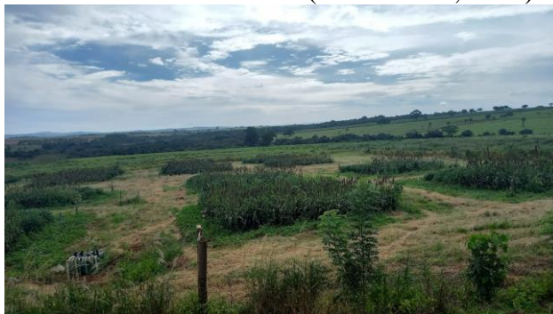
FIGURA 1. Imagem aérea da área experimental – FZEA/USP.

O cultivo foi realizado em parcelas experimentais com 49 m 2 (7 m x 7 m), nas quais a cultura foi semeada manualmente, em profundidade de 3 cm e com espaçamento entre linhas de 0,5 m, perfazendo oito linhas por parcela de sorgo granífero (Figura 1). O manejo da irrigação utilizado no experimento foi em sistema de aspersão convencional com aspersores dispostos nas extremidades de cada parcela experimental, adotando ângulo de operação de 90°, com altura de 1 m acima do solo. Os aspersores utilizados foram os de impacto setorial regulável (modelo 3123-PC360 da marca Senninger®) de bocal de 3,18 mm, com vazão 0,595 m 3 h -1 e a pressão de serviço em 2,41 Bar (35PSI). A umidade do solo foi mantida próxima a capacidade de campo e a medição era realizada utilizando uma sonda portátil Diviner 2000®. Para a avaliação do índice relativo de clorofila, que considera a clorofila a , b e total, utilizou-se o clorofilômetro Clorofilog FALKER, as medições ocorreram aos 44, 64, 90 e 103 dias após a semeadura (DAS), foram geradas as médias. Os dados foram submetidos à análise de variância (Anova) no software estatístico Sisvar 5.3 (FERREIRA, 2019).