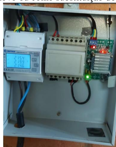
b) Multimedidor de grandezas elétricas