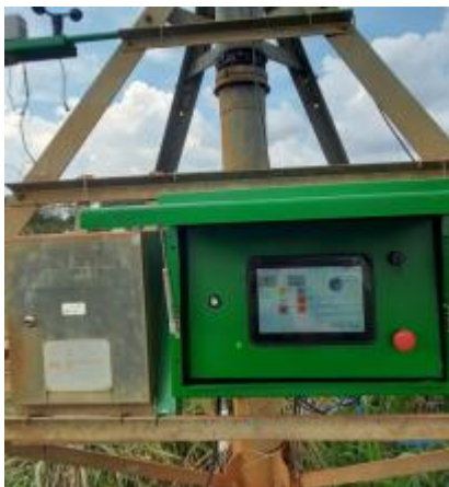
a) Quadro de comando