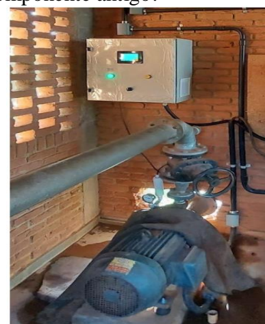
c) Conjunto motobomba e Inversor de frequência