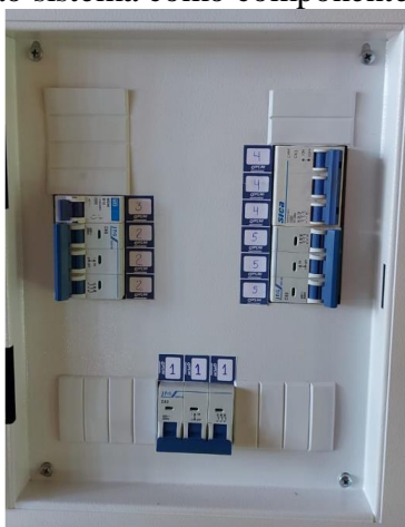
a) Quadro com identificação dos disjuntores

MATERIAL E MÉTODOS: O processo de modernização exige a mudança de alguns componentes do sistema antigo. Assim, são apresentadas as etapas executadas no processo de modernização, começando pelas adequações elétricas, hidráulicas e de infraestrutura, necessários para permitir a implantação das novas funcionalidades do sistema. São apresentadas também a implantação da rede de comunicação de dados e dos equipamentos necessários para o monitoramento remoto das grandezas elétricas e hidráulicas, usadas para a análise de desempenho do sistema e, ainda, a implantação do inversor de frequência usado no controle de velocidade do motor de indução, responsável pelo acionamento da bomba de recalque. Finalmente, apresenta-se resultados da operação do novo sistema. Dentro da etapa de adaptações físicas, a Figuras 1 mostram alguns dos componentes que foram incorporados ao sistema como componente novo ou como substituição do componente antigo.