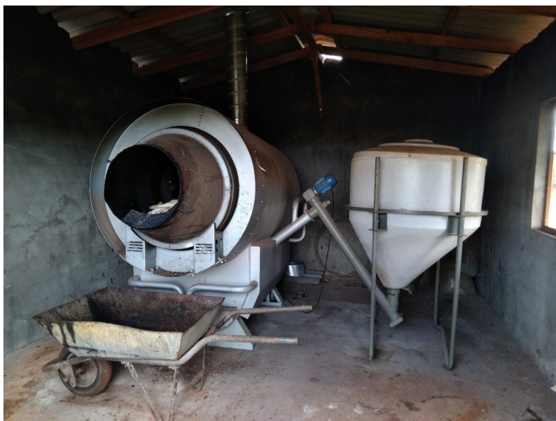
FIGURA 1. Desidratador de carcaças

Processamento das carcaças: Visando a homogeneização das carcaças desidratadas e a acurácia do ensaio de BMP, secou-se o material em estufa de aeração forçada a 105 °C até peso constante e após isso, o material foi triturado, conforme mostram as Figuras 2a e 2b.