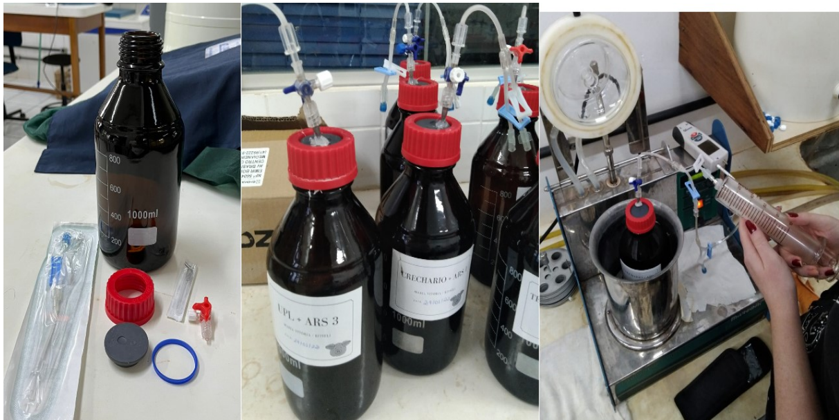
FIGURA 4. Frascos reatores de vidro âmbar com seus componentes para fechamento (A), frascos fechados após remoção de Oxigênio (B) e monitoramento do biogás (C).

diariamente (Figura 4c) e padronizado nas condições normais de temperatura e pressão conforme a norma VDI 4630 (2006).