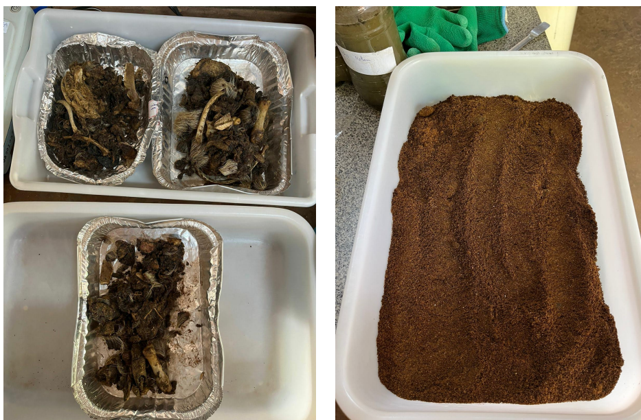
FIGURA 2. Carcaça desidratada sem homogeneizar (A) e homogeneizada (B)

Processamento das carcaças: Visando a homogeneização das carcaças desidratadas e a acurácia do ensaio de BMP, secou-se o material em estufa de aeração forçada a 105 °C até peso constante e após isso, o material foi triturado, conforme mostram as Figuras 2a e 2b.