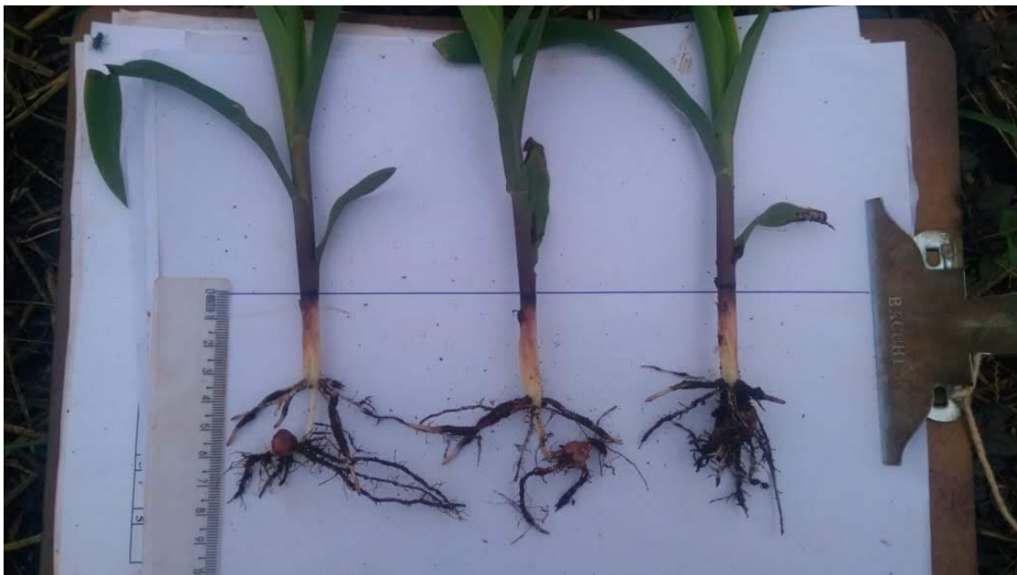
FIGURA 4 . Avaliação da profundidade de semente

O delineamento experimental foi em blocos casualizados, com três regulagens de profundidade de semeadura (parcelas) 8 (regulagem 1), 6 (regulagem 2) e 4 cm (regulagem 3). Os dois mecanismos de transmissão (subparcelas) que acionam o disco dosador de sementes foram: corrente encapsulada (mecanismo 1) e o cabo Elliot (mecanismo 2). As avaliações foram feitas na área útil, que correspondeu aos 10 m centrais da fileira central de cada mecanismo de transmissão do dosador de sementes, com área de 4,5 \text{ m}^2 ( 0,45\text{m} \times 10\text{m} ). Os componentes de produtividade do milho avaliados foram os seguintes: profundidade de semente, índice de velocidade de emergência, população inicial das plantas, população final das plantas, distribuição longitudinal de plantas de milho e produtividade de grãos. Para análise da profundidade de semente, foi realizada a coleta de três plântulas por subparcela e aferida a distância da semente ainda presa a radícula ao colo da plântula (Figura 4).