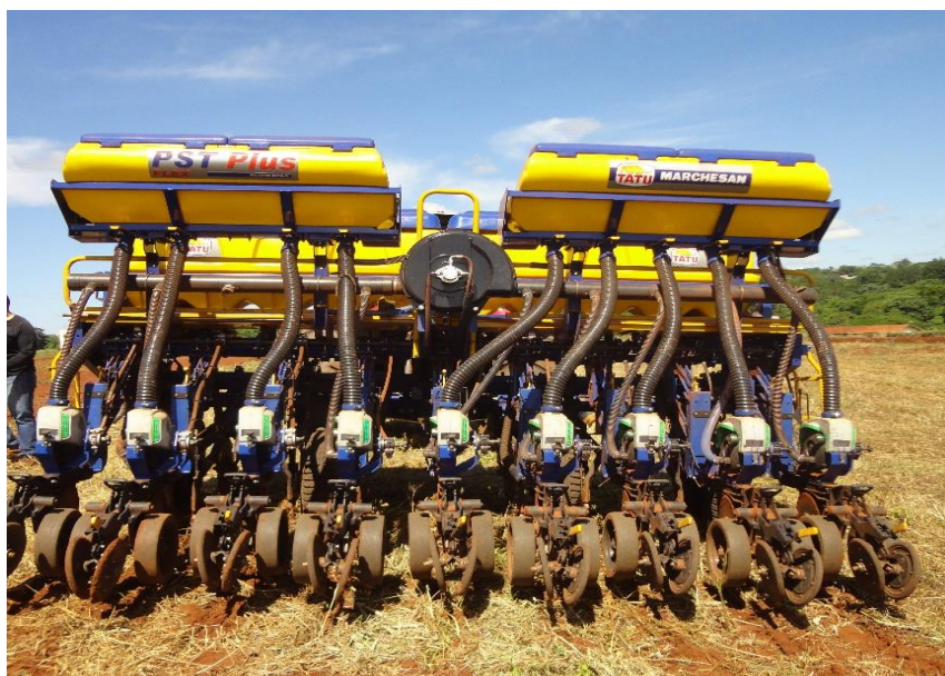
FIGURA 1. Semeadora-adubadora utilizada na semeadura do milho