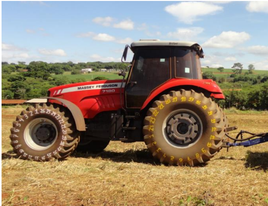
FIGURA 3. Trator utilizado na semeadura

O delineamento experimental foi em blocos casualizados, com três regulagens de profundidade de semeadura (parcelas) 8 (regulagem 1), 6 (regulagem 2) e 4 cm (regulagem 3). Os dois mecanismos de transmissão (subparcelas) que acionam o disco dosador de sementes foram: corrente encapsulada (mecanismo 1) e o cabo Elliot (mecanismo 2). As avaliações foram feitas na área útil, que correspondeu aos 10 m centrais da fileira central de cada mecanismo de transmissão do dosador de sementes, com área de 4,5 \text{ m}^2 ( 0,45\text{m} \times 10\text{m} ). Os componentes de produtividade do milho avaliados foram os seguintes: profundidade de semente, índice de velocidade de emergência, população inicial das plantas, população final das plantas, distribuição longitudinal de plantas de milho e produtividade de grãos. Para análise da profundidade de semente, foi realizada a coleta de três plântulas por subparcela e aferida a distância da semente ainda presa a radícula ao colo da plântula (Figura 4).