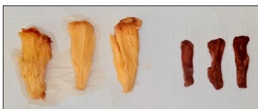
FIGURA 2. Gomos de araticum, antes e após secagem.

Durante o processo de secagem fica evidente o encolhimento dos gomos de araticum (Figura 2 e Tabela 1), explicada pela redução da espessura das fatias ocorrida pela perda de água, ocasionando a diminuição da tensão exercida pelo líquido nas paredes celulares do alimento, assim, induzindo uma contração e resultando em um volume menor. A desidratação reduz os espaços intercelulares, onde o espaço ocupado pela água passa a ser ocupado pela matéria seca (COUTO, 2015). A espessura média dos gomos in natura foi de 6,64 \pm 1,70 mm, já a espessura pós-secagem foi de 2,20 \pm 0,60 mm. Ou seja, a espessura da polpa reduziu em 66,78%. Couto (2015) mensurou uma espessura média de 6,6 mm para a polpa de araticum in natura e de 1,3 mm para a polpa totalmente desidratada; ou seja, muito próximas aos valores determinados por este trabalho. Destaca-se também que os araticuns utilizados por Couto (2015) são originários de Brasília, DF e o deste trabalho são provenientes de Barreiras, BA, regiões onde predomina o bioma Cerrado, sendo muito similares quanto aos aspectos do solo e clima. É comum haver diferenças físicas entre uma mesma espécie por diversos fatores, como região de obtenção.