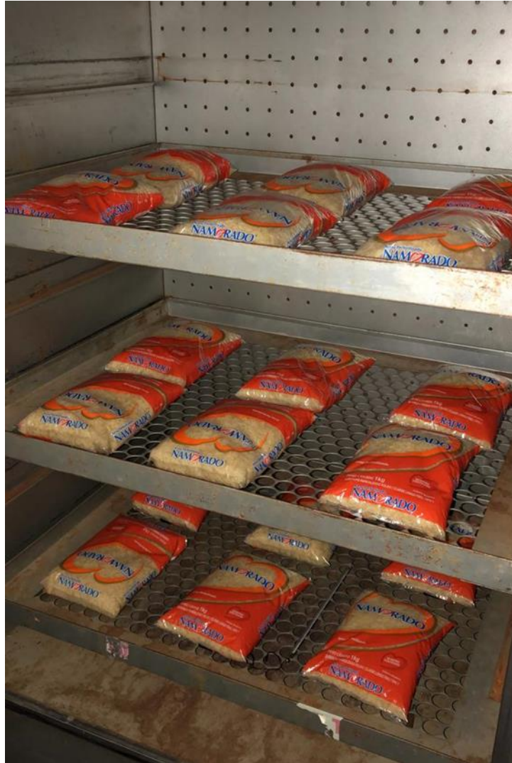
FIGURA 1. Distribuição das amostras de arroz parboilizado na estufa.

A umidade inicial dos grãos foi estabelecida em 12%, na qual os grãos se encontram quando são embalados para a comercialização. A umidade dos grãos foi averiguada após as amostras serem retiradas da estufa através do equipamento medidor de umidade de grãos Gehaka G939. Para a classificação do arroz, sendo considerado seus requisitos de identidade e qualidade, a amostragem, o modo de apresentação e a marcação ou rotulagem foram realizados conforme a Instrução Normativa Nº 06, de 16 de fevereiro de 2009 (BRASIL, 2009). Onde primeiramente foi realizado o quarteamento e em seguida as análises necessárias para classificação do arroz. Através do teste de sanidade de sementes foi realizada a análise dos grãos. A sanidade da semente refere-se, à presença ou ausência de agentes patogênicos, como fungos, bactérias, vírus, nematóides e insetos (BRASIL, 2009). As amostras foram colocadas em recipientes plásticos, em seguida foram inseridas no germinador de sementes, ficando expostas a esse ambiente controlado de 20 \pm 2 °C por 10 dias (Figura 2), após, foram retiradas para análise (Figura 3).