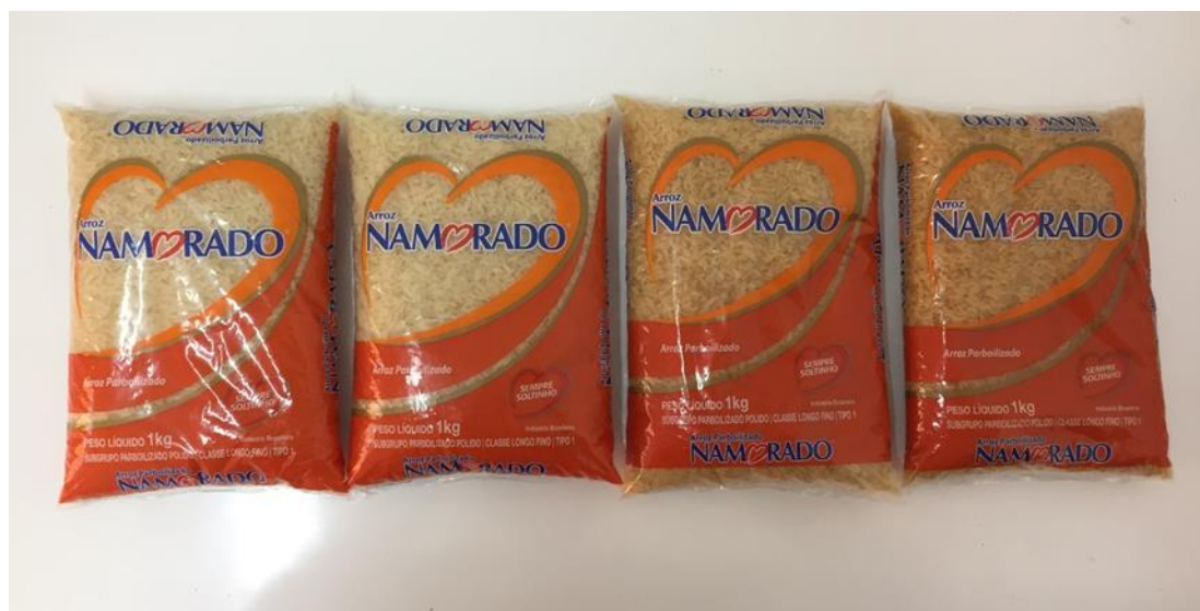
FIGURA 4. Diferença de coloração no arroz submetido a 40, 50 e 60°C.