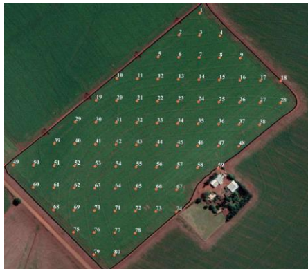
FIGURA 1. Malha amostral gerada usando o QGIS.

RESULTADOS E DISCUSSÃO: O estande de plantas final foi de 3,14 plantas m^{-1} , resultando em um estabelecimento da totalidade das sementes depositadas em campo (Tabela 1). Isso demonstra que a adoção de sistema de controle automático do dosador de sementes de milho pode alcançar 100% de emergências de plântulas. TOURINO e KLINGENSTEINER (1983) consideravam como ótimo desempenho de uma semeadora aquela que obtinha uma distribuição acima de 90% das sementes dentro da faixa de espaçamento aceitável (normal). Desse modo, os dados de espaçamento normal do trabalho encontram-se dentro da classificação considerada ótima. A distribuição de falhos (4,85%) atingiu a meta para uma boa distribuição longitudinal de sementes, que está abaixo de 5%.