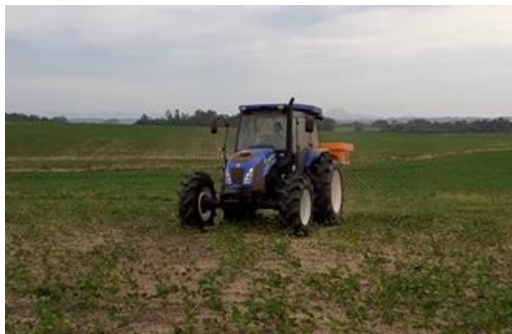
FIGURA 1. Conjunto mecanizado.

MATERIAL E MÉTODOS: A coleta dos níveis de ruído foi realizada na propriedade rural localizada no município de Novo Cabrais – RS (-29.819815, -53.050793), utilizando medidor integrador de uso pessoal, decibelímetro de ruído da marca Instrutherm. Este foi instalado próximo à zona auditiva do operador, a uma distância de quinze centímetros do ouvido, conforme a ABNT 2017 (ISO 5131), com intuito de medir a intensidade sonora mais próxima possível do que o trabalhador esteja realmente sendo exposto. As condições do ambiente foram respeitadas como descrito na ISO 5131, onde o ruído do ambiente e do vento no local de instalação do microfone deve ser de pelo menos 10 dB(A), abaixo do nível de ruído medido durante o ensaio, para essa verificação foi utilizado o Termo-higro-anemômetro-luxímetro, modelo thal-300. Foram realizadas seis repetições, em cada uma coletados 100 dados de ruído aleatórios, com o trator cabinado (New Holland TL 75) em movimento realizando distribuição de fertilizante sólido à lanço com distribuidor de disco simples montado (Figura 1).