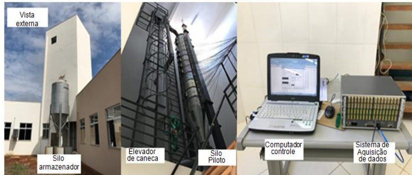
FIGURA 2. Estação experimental do silo-piloto no Centro de Pesquisa em Processamento de Produtos Agrícolas CPPPA da Universidade Federal de Lavras.

A altura total dos 12 anéis totaliza 6 metros e um volume de armazenamento de 2,35 m 3 . Cada anel é composto por 2 semicírculos simétricos e unidos por um conjunto de duas células de cargas tipo extensômetros, totalizando 24 extensômetros de 80kN, para determinação da força normal nas paredes do silo-piloto. Para obtenção dos dados será utilizado um sistema de aquisição de dados conectado a um computador portátil (Figura 2).