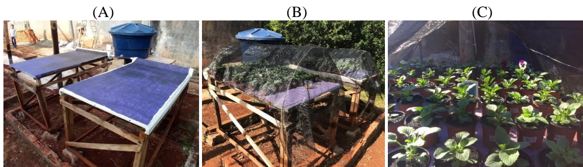
FIGURA 1. Bancadas inclináveis com sistema de fornecimento de água (A), cobertas com tela de sombreamento 50% (B) e disposição dos vasos de amor-perfeito ( Viola x wittrockiana ) (C).

todo o experimento, utilizou-se uma boia de caixa d'água dentro dos reservatórios, que eram alimentados por um outro reservatório com capacidade para 200 L. A partir desse sistema, a água foi fornecida às plantas por capilaridade.