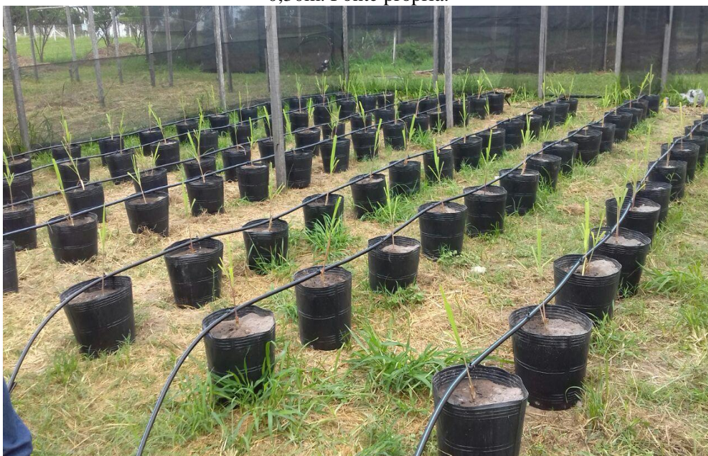
Figura 1: Disposição de vasos na estufa, com espaçamento entre linhas de 1,0m e entre vasos de 0,30m.

A cultura foi irrigada por um sistema de irrigação localizada utilizando gotejadores. Sendo o sistema constituído de: mangueira de polietileno de 16 mm de diâmetro; gotejadores NETAFIM com vazão de 4L.h^{-1} e pressão de serviço de 10 m.c.a, que foram integrados no espaçamento de 0,30 m, com apenas um emissor por planta.