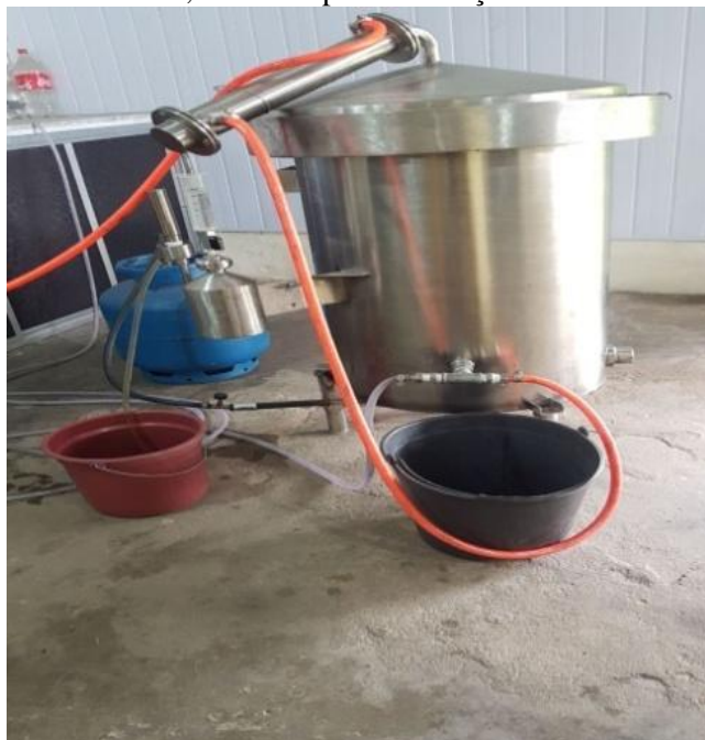
Figura 5: Destilador D10-Linax, utilizado para a extração de óleo da citronela.

Para realizar uma segunda extração de óleo, o material extraído foi colocado em recipientes de vidros e etiquetados e congelados.