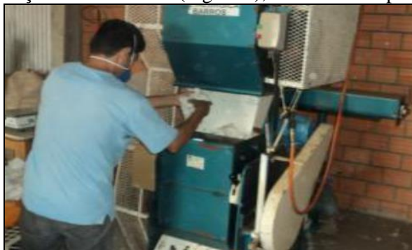
FIGURA 1 – Descaroçamento das amostras colhidas a campo.

Inicialmente, foram colhidas manualmente amostras aleatórias no campo, totalizando 42 amostras. Sendo que, para locais de relevo mais acidentado colheu-se maior número de amostras, com o intuito de melhorar a representatividade do talhão (YAMAMOTO, 2013). Estas amostras foram beneficiadas com o auxílio de um descaroçador de 20 serras (Figura 1), desenvolvido pela metalúrgica Barros.