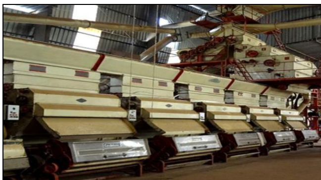
FIGURA 2 – Descaroçadores de 90 serras.