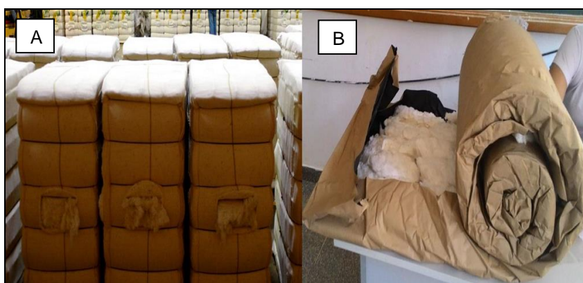
FIGURA 3 – A) Fardinhos formados após o beneficiamento. B) Amostras retiradas dos fardinhos.

Para geração do mapa de variabilidade espacial foi utilizado o software FalkerMap® Versão 1.35 (Figura 4).