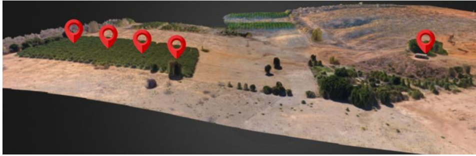
FIGURA 2. Locais de instalação da placa de coleta de dados.

Outro teste feito na placa foi o do consumo de energia alterando o modo de consumo de energia do microcontrolador para verificar a viabilidade de funcionamento utilizando baterias recarregáveis com a recarga utilizando um painel solar e hidro gerador de energia elétrica. A Tabela 1 apresenta os dados obtidos com as medições do consumo de energia da placa.