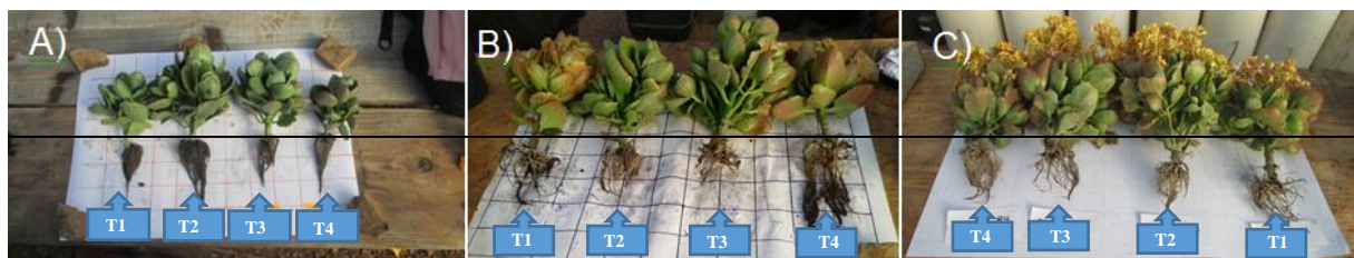
FIGURA 2. Sistema aéreo e radicular do Kalanchoe , nos diferentes estágios da cultura, (A) aos 51 DAT, (B) aos 103 DAT e (C) aos 133 DAT, e tratamentos de irrigação.

Na figura 2 são apresentadas as imagens das plantas, nas destruições realizadas ao longo do ciclo. Nota-se, em ambas as destruições, que o tratamento com a maior reposição de água apresentou sistema radicular com menor extensão vertical. Conforme DALRI (2006), para turnos de rega com alta frequência de irrigação, ou taxa elevada de água, o sistema radicular tende a ficar contido dentro do bulbo molhado, enquanto para um turno de rega com maior intervalo entre irrigações, ou com menor lâmina, o sistema radicular tenderá a ocupar volume maior de solo para suprir as necessidades hídricas da cultura.