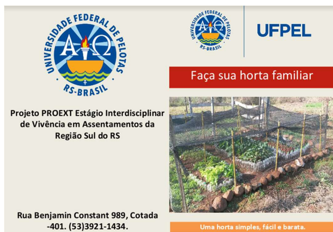
Figura 4. Parte do manual de construção de horta familiar

Com as visitas foi possível observar que o hábito de uma alimentação mais saudável não era adotado por essas famílias e a criação de hortas faria a diferença nessa realidade. Devido a isso foi realizado um folder orientando as famílias a realizar uma horta de simples construção (Figura 4).