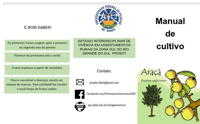
Figura 5. Parte do Manual de cultivo de araçá

Em suma, podemos concluir que esses pequenos agricultores quando recebem seu lote de terra para habitar e gerar seu sustento permanece passando por dificuldades para mantê-lo, e é aí que o estágio de vivência pode ser crucial para a melhoria de vida destas pessoas. O projeto de Estágio de Vivência Interdisciplinar em Assentamentos da Zona Sul do Rio Grande do Sul é uma troca, onde os alunos participantes doam suas aptidões obtidas dentro das salas de aula para o desenvolvimento de recursos em prol do assentado. Em troca é proporcionado a este uma instrução não recebida durante a sua graduação e que os próprios assentados lhe cedem seus saberes adquiridos durante a vida toda por meio da vivência no meio rural. O aluno também tem a oportunidade de pôr em prática tudo que aprendeu na universidade. Tem a chance de conviverem com uma realidade social, política, econômica e cultural diferente da sua, o que pode gerar-lhes uma visão mais crítica da sociedade. E por fim ganha a experiência de trabalhar com outras áreas, com pessoas diferentes e assim se tornar um profissional mais qualificado, mas também um indivíduo com moral e princípios que se preocupa com o próximo. O projeto visa melhorar a vida dos assentados, mas também proporcionar uma melhor formação aos alunos participantes, formando profissionais experientes e qualificados.