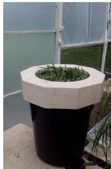
FIGURA 2. Aplicação do GA_3 com uma proteção para evitar deriva e padronização da altura de corte do capim-tifton-85, Viçosa – MG, 2017.

No presente estudo para simular o esgoto sanitário, utilizou-se a solução de origem sintética (Nopens et al. , 2001). Os sais e ingredientes foram diluídos em água de abastecimento. A concentração final do afluente pode ser observado na Tabela 1.