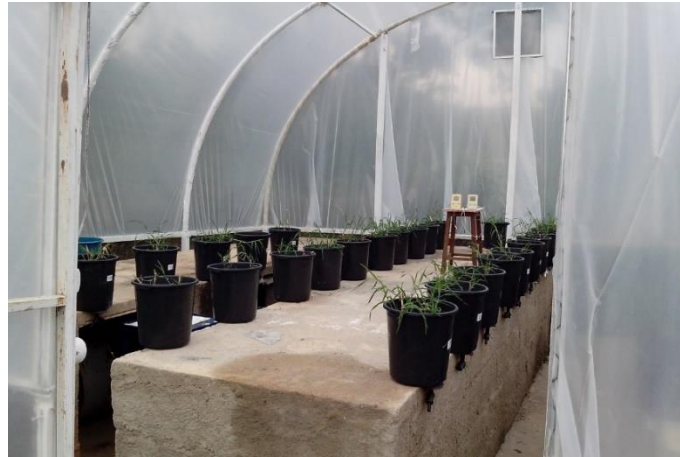
FIGURA 1. Sistemas alagados construídos e disposição do experimento em blocos casualizados, Viçosa – MG, 2017.

O delineamento experimental foi em blocos casualizados com quatro repetições, os blocos foram as bancadas na casa de vegetação Figura 1, totalizando 20 parcelas experimentais com o capim-tifton-85 e aplicação de diferentes doses de GA_3 .