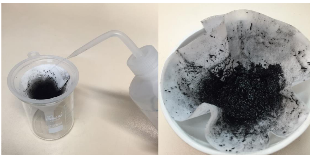
FIGURA 1 – Lavagens da Cinza da Casca de Arroz para neutralização do pH

No processo de ativação do carvão, as cinzas foram previamente secas em estufa a aproximadamente 110°C, pelo período de 1h, para remoção da umidade. O agente ativador utilizado foi o ácido clorídrico. Para tal, uma solução de HCl foi preparada a uma concentração de 3 mol L -1 . Adicionou-se 5g de cinza em 100 ml da solução de HCl, os quais foram mantidos sob agitação constante em agitador magnético por 2h. Após esse período, a solução foi filtrada e posteriormente recebeu sucessivas lavagens com água destilada, para a neutralização do seu pH, conforme mostra a figuras 1.