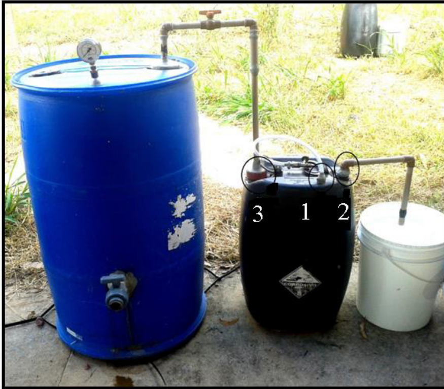
FIGURA 1 - Biodigestor caseiro e galão quantificador de biogás; 1- Para realizar teste de chama; 2 – Saída da água do quantificador e abastecimento do quantificador; 3- Introdução do biogás no quantificador.

Após o abastecimento do biodigestor, deu-se início ao processo de fermentação anaeróbica na qual pode se citar como a fase principal da produção de biogás e durante todo esse processo da produção de biogás, foram coletados dados como, temperatura máxima e mínima do dia como também a quantidade de biogás produzida ao dia. Em relação às leituras das temperaturas, e a quantidade de gás produzido, estas foram feitas no período vespertino, das 14:00 e 15:00 horas. Para verificação da temperatura diária, foi utilizado um termômetro de mercúrio.