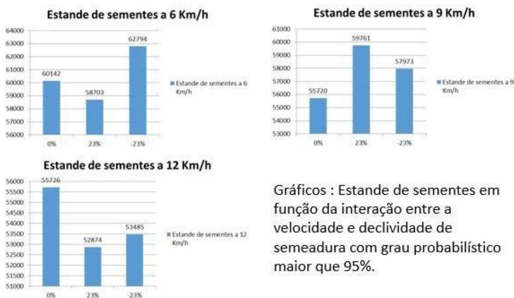
Figura 2-Interação da velocidade x declividade

Gráficos : Estande de sementes em função da interação entre a velocidade e declividade de semeadura com grau probabilístico maior que 95%.