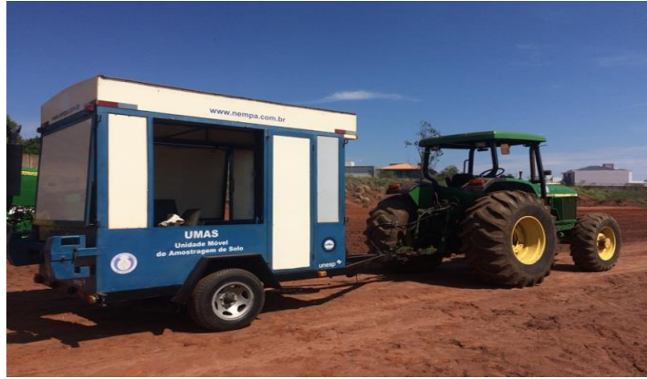
FIGURA 1 - Unidade Móvel de Amostragem do solo - UMAS

A resistência a penetração do solo foi obtida até a profundidade de 30 cm. A coleta foi realizada na linha de tráfego com 4 pontos dentro 2 pontos fora da linha em forma de transepto com espaçamento de 15 cm entre os pontos. O cálculo do Índice de Cone do solo realizada nas camadas de 0 a 10; 10-20 e 20-30 cm.