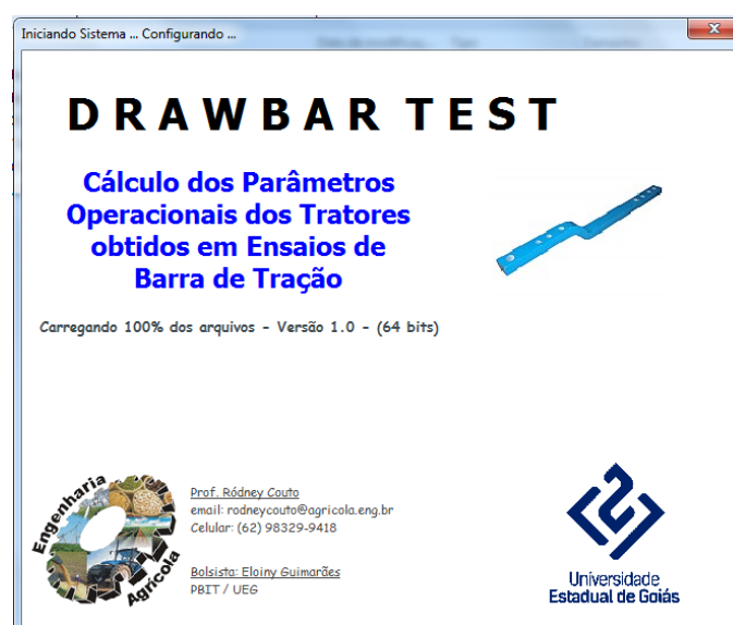
FIGURA 1. Tela de inicialização do tipo splash screen do software que foi sendo produzido. A interface do software é composta por um formulário principal contendo várias abas. Na aba Dados do Trator foram inseridos objetos do tipo TextBox os quais são alimentados pelo

RESULTADOS E DISCUSSÃO: Ao iniciar o software é mostrado ao usuário uma tela de inicialização, do tipo splash screen, confeccionada em um formulário onde são informados o nome do programa, objetivos, informações dos desenvolvedores e as logomarcas do software, do curso de vinculação dos desenvolvedores e da Universidade Estadual de Goiás (Figura 1).