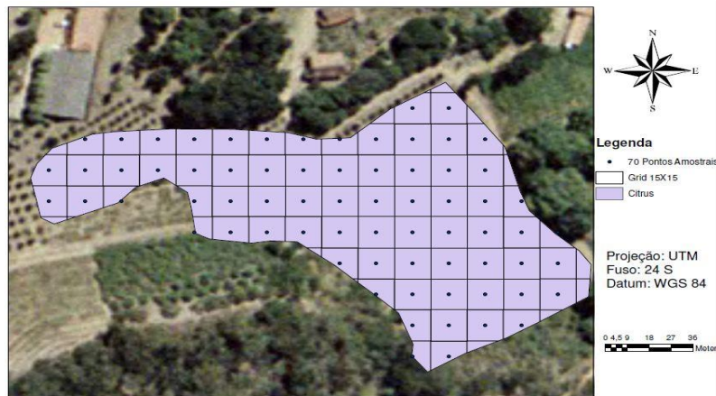
Figura 1 – Mapa da área de citricultura contendo os pontos amostrais.

Na etapa de análise dos resultados foram analisados os mapas gerados pela Krigagem ordinária e IDW.