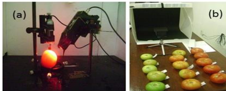
FIGURA 1. Configuração para a aquisição das imagens do biospeckle laser (a) e imagens digitais (b).

digitais, foi utilizado um estúdio de fotografia para pequenos objetos, no qual cada tomate foi posicionado a uma altura de 0,100 m da base do estúdio. A câmera digital foi posicionada em um tripé, com altura de 0,170 m e a uma distância de 0,225 m do tomate. Não houve alteração na conformação do esquema durante a aquisição de todas as imagens.