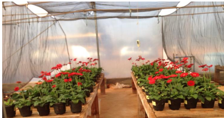
Figura 1 – Vista geral do das unidades experimentais e arranjo da tela de sombreamento

(FERREIRA, 2008) em regressão polinomial.