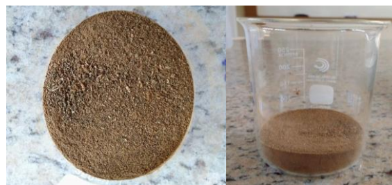
Figura 1: Quiabo após desidratação (a), trituração e peneiramento (b).

A coleta da água foi realizada no Serviço Autônomo Municipal de Água e Esgoto (SAMAE) localizada na cidade de Iporã/PR. A água foi coletada na entrada do sistema, não recebendo assim nenhum tipo de tratamento prévio. O ensaio foi realizado no Laboratório de Saneamento e no Laboratório de Poluentes Atmosférico da Universidade Tecnológica Federal do Paraná (UTFPR) Campus Londrina. Para realizar o preparo da solução de quiabo, inicialmente foi necessário que o quiabo fosse desidratado. Após obtido o pó do quiabo desidratado (Figura 1a e 1b), foi pesado 50g do mesmo e misturado com 1L de água destilada.