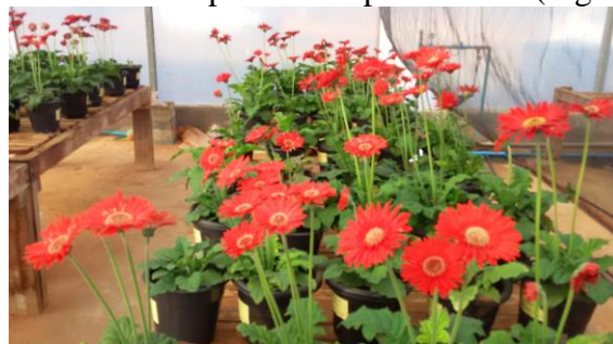
FIGURA 1. Vista geral do experimento do cultivo de gérbera sob disponibilidade hídrica e cinza vegetal.

MATERIAL E MÉTODOS: O experimento foi conduzido em casa de vegetação na UFMT- Universidade Federal de Mato Grosso, Campus Universitário de Rondonópolis. Instalou-se, ao longo da área ocupada pelo experimento, na parte interna da casa de vegetação, uma tela de sombreamento (50%) para promover um leve sombreamento e propiciar o desenvolvimento das plantas de gérbera. O delineamento experimental utilizado foi em blocos casualizados, em esquema fatorial 5x5, com cinco níveis disponibilidade hídrica (40, 60, 80, 100 e 120% da capacidade de pote), e cinco doses de cinza vegetal (0, 8, 16, 24 e 32 g dm -3 ) com quatro repetições, totalizando 100 parcelas experimentais (Figura 1).