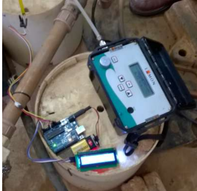
FIGURA 1. Sensor de pressão MPX5700 e manômetro digital Lamon DMP-01-DP

Para determinação da curva de calibração, foram obtidos 14 pares diferentes valores de pressão no tubo, com variação de leitura entre 10 e 60mca, em byte para o caso do conjunto arduino- MPX 5700 e de carga de pressão em mca para o Lamon DMP-01-DP.