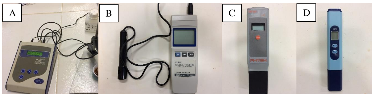
Figura 1: Medidores de condutividade elétrica. Condutivímetro de bancada mCA150

MATERIAL E MÉTODOS: Um ensaio foi montado em casa de vegetação na área experimental do Instituto de Ciências Agrárias e Tecnológicas – ICAT. Como tratamentos, foram adotados oito níveis de condutividade elétrica (atual do solo; 1,0; 2,0; 3,0; 4,0; 5,0; 6,0 e 7,0 \text{dS m}^{-1} ), em quatro repetições, totalizando 32 unidades experimentais. Os tratamentos foram submetidos à irrigação, com soluções salinizantes (Cloreto de Potássio) e a incubação em sacos de plástico por um período de 20 dias. Após a incubação, o solo foi seco ao ar, misturado, homogeneizado e peneirado em malha de 2 mm (Terra Fina Seca ao Ar - TFSA). De acordo com a metodologia proposta pela EMBRAPA (2011), foi obtido o extrato aquoso da pasta de saturação, para determinação da condutividade elétrica, baseado no princípio da determinação dos sais solúveis nos solos pela medição de cátions (+) e ânions (-). A condutividade elétrica foi medida por meio de condutivímetros, à 25°C, os sensores utilizados nas análises foram o condutivímetro de bancada mCA150 Tecnal ® (como padrão), o condutivímetro semi-portátil WT-3000 iCEL ® , condutivímetro de bolso CD-203 Phtek ® e o Hidroponia Digital CE Condutividade Tester (Figura 1). Os resultados foram submetidos a análise de regressão, a 5 % de probabilidade, por meio do programa SISVAR (FERREIRA, 2011).