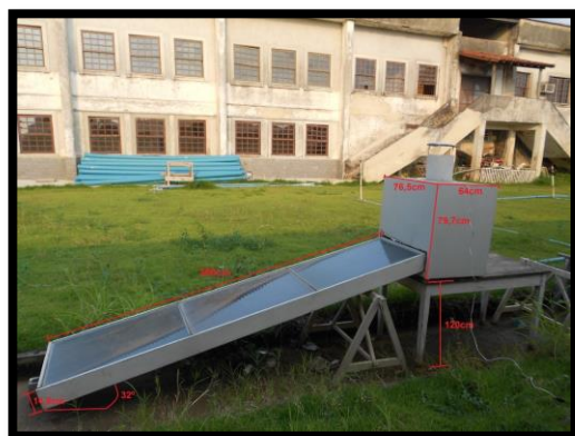
Figura 1. Dimensões e posicionamento do secador

RESULTADOS E DISCUSSÃO: A secagem da maçã totalizou 75 h, com 13 h de intermitência, que ocorreu no período noturno. Observou-se uma drástica redução do teor de água nas cinco primeiras horas de secagem, com percentual em torno de 80%, conforme a figura 2. Em estudo sobre a secagem da carambola em secador de bandeja, SANTOS et al. (2010), observou o mesmo fenômeno.