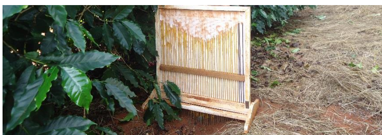
FIGURA 1. Utilização do perfilômetro na avaliação do índice de rugosidade do solo.

MATERIAL E MÉTODOS: O experimento foi realizado na Fazenda Gaúcha, situada no município de Presidente Olegário, Minas Gerais, em lavoura de Catuaí Vermelho IAC 144, com 10/11 anos de idade, em solo LV. Havia no solo cerca de 10 sacas de café ben. ha -1 , podendo considerar esta, uma situação de média quantidade de café no chão. Os tratamentos foram constituídos de três manejos de solo subsolado (ST- Subsolador e Trincha, SG- Subsolador e Grade, SGT- Subsolador, Grade e Trincha) além de um controle, sem subsolagem. A subsolagem e seus tratos posteriores foram realizados por um subsolador semi-halado de duas hastes da marca Ykeda, Trincha FLV175 da marca Herder e uma grade leve tipo tendem 1BJX-1,7 com disco de 16” da marca Shengda. As operações de solo foram realizadas em setembro de 2014 e a arruação em julho de 2015. A varrição foi realizada por um conjunto mecanizado composto por trator John Deere 5425N e um Arruador/soprador Varre Tudo da marca Mogiana. O delineamento experimental utilizado foi o de faixa. A avaliação do índice de rugosidade da área foi obtida por meio de um perfilômetro com 40 hastes espaçadas em 1 cm, em 25 pontos avaliados por tratamento (Figura 1). As hastes deste aparelho copiam o perfil do solo, sendo possível verificar a rugosidade do local onde se passou a ponteira do subsolador, assim como os efeitos dos manejos realizados após a operação de subsolagem.