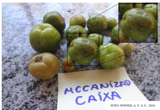
FIGURA 4. Injúrias provocadas na colheita mecanizada, transporte em caixa, Ubajara-CE, 2013.