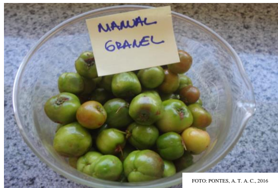
FIGURA 3. Fruta colhida manual, transportadas a granel, Ubajara-CE, 2013.