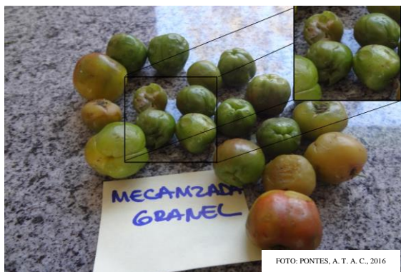
FIGURA 5. Injúrias provocadas na colheita mecanizada, transporte a granel, Ubajara-CE, 2013.