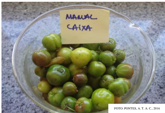
FIGURA 2. Fruta colhida manual e transportadas em caixa, Ubajara-CE, 2013.

A redução dos níveis de vitamina C colhidas de forma mecanizada, reforça resultados encontrados por outros autores como Burton & Schulte-Pason (1987), que evidenciaram aumento na evolução de CO 2 de cerejas injuriadas submetidas a várias intensidades de impacto. Injúrias por impacto também foram responsáveis por aumentos na atividade respiratória de melões (MAC LEOD et al., 1976) e de maçãs (PARKER et al., 1984). As injúrias variaram de leves (FIGURA 3) a grave (FIGURAS 4 e 5) ou sem nenhum dano mecânico (FIGURA 2).