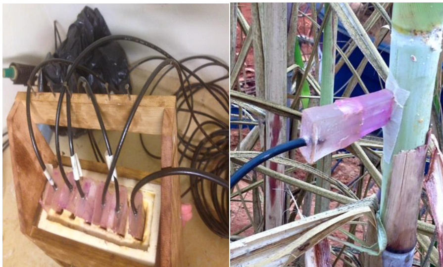
FIGURA 1. Construção das sondas em laboratório e instalação das sondas no colmo da cana.

As caixas foram montadas com Neossolo Quartzarênico e uma malha de 20 sondas TDR. As sondas construídas são caracterizadas por utilizar hastes de solda de aço inoxidável de 1,6 mm de diâmetro, cortadas a 70 mm de comprimento para serem soldadas em um cabo coaxial, cuja outra extremidade foi inserido um conector BNC. Foram escolhidos três colmos de cana de açúcar por caixa, totalizando 24 sondas (Figura 1).