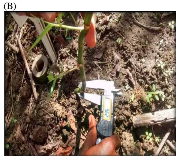
FIGURA 1. Medições de altura da planta com trena (A) e diâmetro do colmo com paquímetro digital (B)

RESULTADOS E DISCUSSÃO: Na Tabela 1, pode-se visualizar o resumo da análise de variância para as variáveis estudadas. Verifica-se que apenas a variável altura de plantas respondeu significativamente a 5% ( P < 0,05 ), para o tratamento formas de propagação, não sendo observada nenhuma significância para o tratamento dias após o transplântio (DAT), e nem para interação entre os fatores.