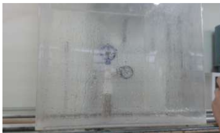
FIGURA 1. Aspersor sendo avaliado.

MATERIAL E MÉTODOS: O experimento foi realizado no Laboratório de Hidráulica Agrícola da Universidade Federal de Santa Maria (UFSM). Nos testes, foram utilizados os aspersores comerciais do modelo P5 da marca Agrojet. A avaliação da vazão foi realizada através de um hidrômetro juntamente com um cronômetro para estimar a vazão obtida para cada pressão de serviço, a pressão de serviço foi monitorada por meio de um manômetro instalado no cano de elevação próximo ao aspersor testado. Utilizou a seguinte expressão para obtenção do valor de vazão medida: Q = V \times T onde: Q é a Vazão medida (l/h); V é o volume (l) e T é o tempo (h). Foram testadas as 5 pressões de trabalho que se encontram no catálogo do aspersor (10 ; 15; 20; 25 e 30 mca), para obtenção da média da vazão, bem como a correlação entre as vazões teórica e observada, foram utilizadas 3 repetições para cada valor de pressão, sendo anotado as vazões obtidas.