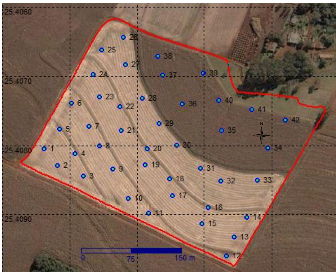
FIGURA 1. Grade amostral utilizada para determinação da resistência do solo a penetração e produtividade do milho.

A resistência do solo à penetração foi determinada utilizando-se um penetrômetro eletrônico da marca Falker PenetroLOG, com o qual foram realizadas quatro medições no entorno do ponto definido na grade amostral (a distância máxima de 3 m), calculando-se posteriormente a média das medições para representação do ponto, nas profundidades de 0-0,1, 0-0,2, 0,1-0,2 e 0,2-0,3 m.