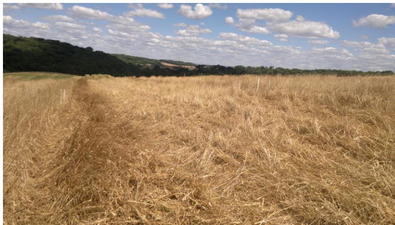
FIGURA 1 – Área experimental

No campo (Figura 1) o experimento ficou dividido em delineamento de blocos ao acaso com parcela subdividida, sendo que o fator principal foi doses de fertilizante, e como secundário o dosador. As doses foram: sem critério técnico; reposição e manutenção e de investimento, a primeira era empregado a dose média da região para a cultura em análise, a segunda era realizada o cálculo em cima da análise de fertilidade do solo já a terceira era 20% superior a segunda. Os dosadores de fertilizante empregados foram, helicoidal por gravidade e por transbordo conforme é demonstrado na Figura 2. Ambos os dosadores estavam equipados com a rosca helicoidal de 2”.