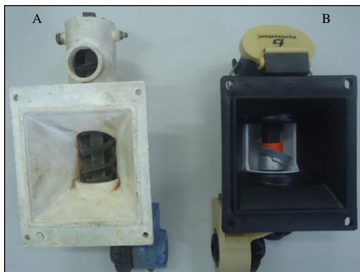
FIGURA 2. A) dosador de fertilizante helicoidal por gravidade; B) dosador helicoidal por transbordo.

Os dados foram tabulados em planilha eletrônica e submetidos a avaliação estatística que constou de análise descritiva, teste de variância e comparação de médias pelo Teste de Tukey ao nível de 5% de probabilidade, todas realizadas pelo Assitat 7.7beta (SILVA & AZEVEDO, 2009).