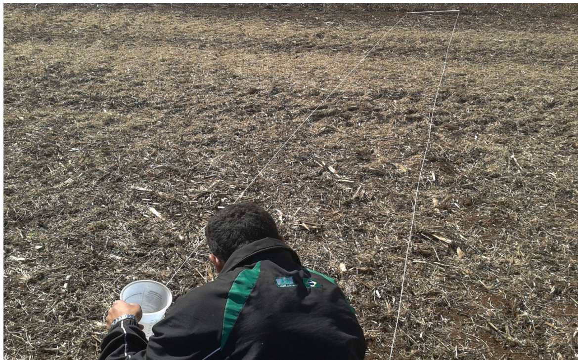
Figura 1. Coleta das perdas com o gabarito de 2m 2 .

máquina e perdas totais. A área de cada avaliação foi de 2 m 2 , sendo utilizado gabarito para a coleta (Figura 1).