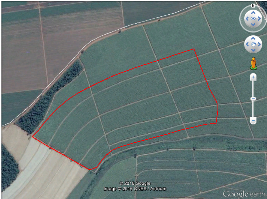
FIGURA 1. Delimitação da área de estudo (polígono vermelho).