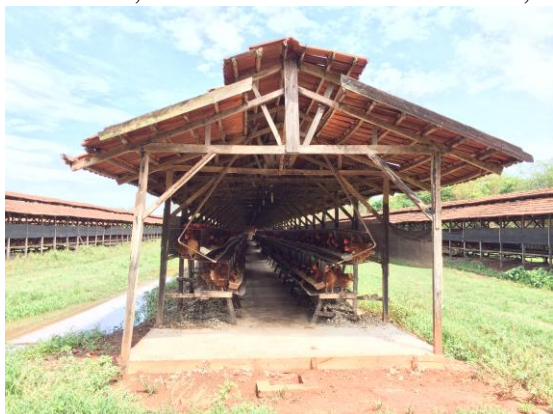
Figura 1. Vista geral do galpão industrial de produção de ovos

Na Granja onde ocorreu o experimento tem um sistema de produção caracterizado como convencional, onde as aves eram dispostas em gaiolas aramadas com as dimensões de 45x50x45, com a densidade de 2250cm 2 , como observado na Figura 1. e 2.