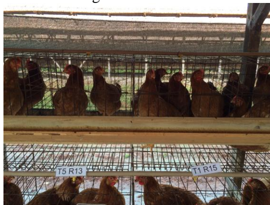
Figura 2. Disposição das gaiolas referentes aos diferentes tratamentos dentro do galpão

O delineamento experimental utilizado inteiramente casualizado, este contendo cinco tratamentos, que serão representados pelas diferentes densidades de gaiola e 25 repetições que representam as repetições para cada tratamento, onde foi aplicado ANOVA e em caso de significância foi utilizado o teste de Tukey a 5% de significância.