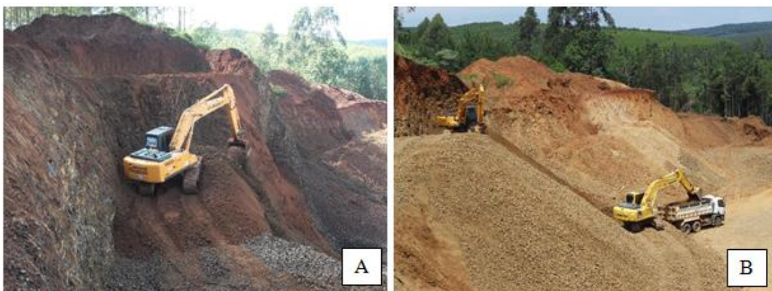
FIGURA 1. Extração de cascalho (A), extração e carregamento de cascalho (B), carregamento de cascalho (C e D).