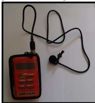
Figura 1- Dosímetro digital DOS-500